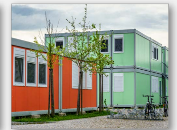
Containerbau / Einhausungen